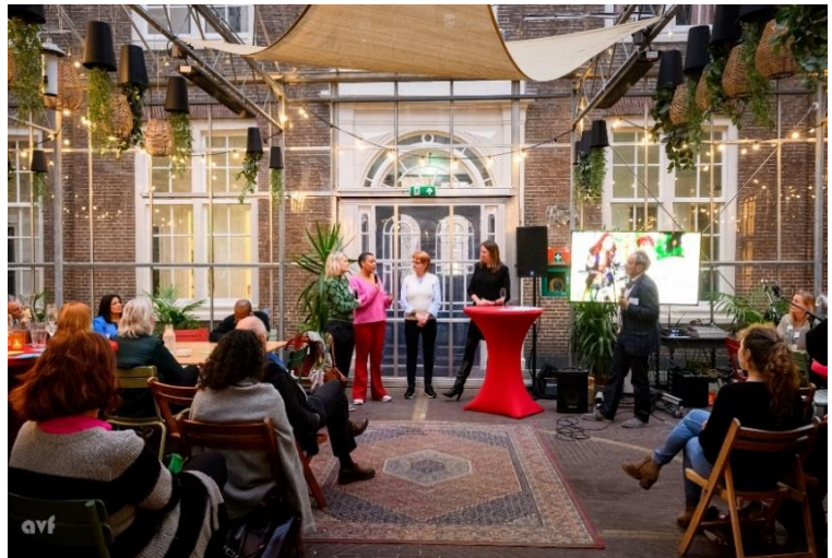
In een vol atrium van het Huis van de Diaconie onderzochten de panelleden onder leiding van de voorzitter de positie van Leergeld tussen leef- en systeemwereld.

Daarin konden de panelleden én de zaal zich vinden.